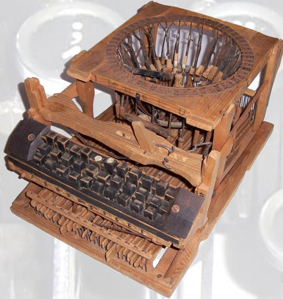
Mitterhofer Schreibmaschine - Modell 1

Dieser „Nadeldrucker“ legte den Grundstein für eine ganz neue Ära der Texterfassung.